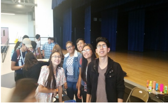
Equipo de Acción Juvenil de Montana Vista

El Equipo de Acción Juvenil de Montana Vista también arregló el huerto de la Clínica Montana Vista de PVHC. El equipo comenzó a colaborar con el Grupo de Apoyo para el Autocontrol de la Diabetes de Montana Vista , regando y cuidando el huerto. Las verduras y hierbas que se cosechen se usarán para las clases de Cocina Saludable .