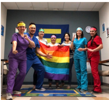
¡El personal de la Clínica Naftzger está listo para luchar por una atención médica inclusiva para los pacientes LGBTQ!