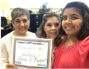
El personal de Finanzas de PVHC apoyando la Semana de Promoción de la Salud LGBTQ.