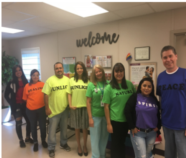
El personal de la Clínica Montana Vista Clinic demuestra su apoyo durante la Semana de Promoción de la Salud LGBTQ.